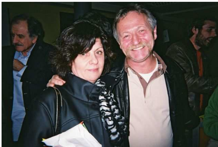
EA et AB avec R&PS pour faire élire José Bové (p. 3)